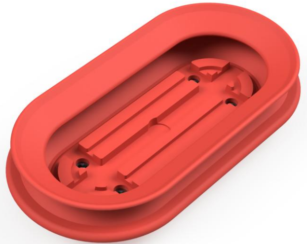
Abbildung: FL 150 300