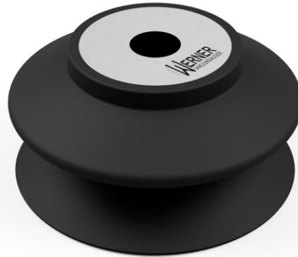
Abbildung: FSC 80