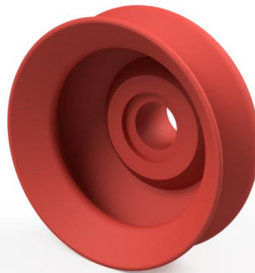
Abbildung: FNX 40