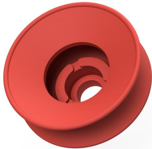
Abbildung: FNKB 80