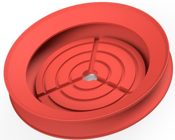
Abbildung: FR 200