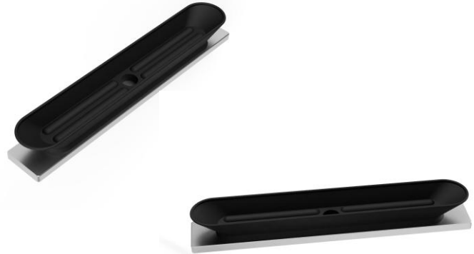
Abbildung: LWF 35 200