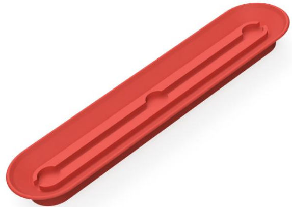
Abbildung: L 55 200