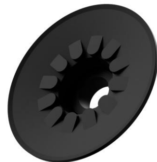
Abbildung: SNKB 100