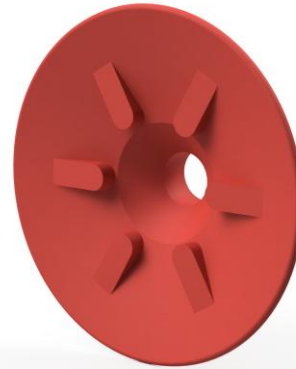
Abbildung: SNSK 60