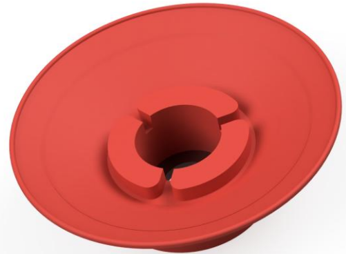
Abbildung: SSA 60