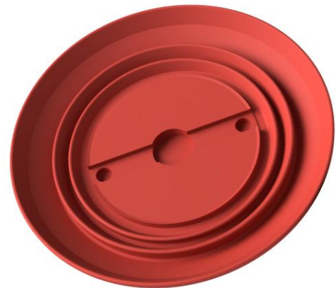
Abbildung: SRK 110