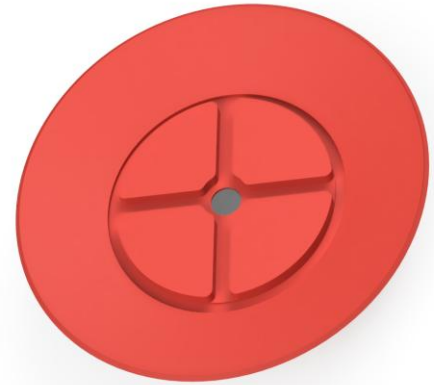
Abbildung: SRD 55