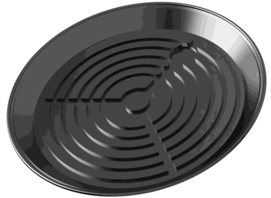
Abbildung: SR 300