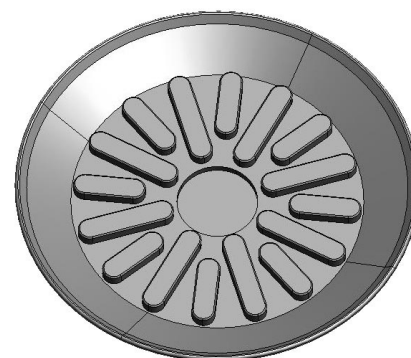
Abbildung: SRD 140