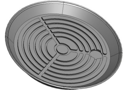
Abbildung: SR 300